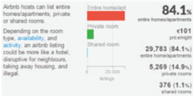
Figure 72: Room type – Paris