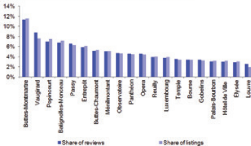
Figure 75: Private room listings and reviews: well matched

Source: Deutsche Bank, Inside Airbnb Filtered min 1 night and >0 reviews Data is rounded and includes average 10.5% service fee