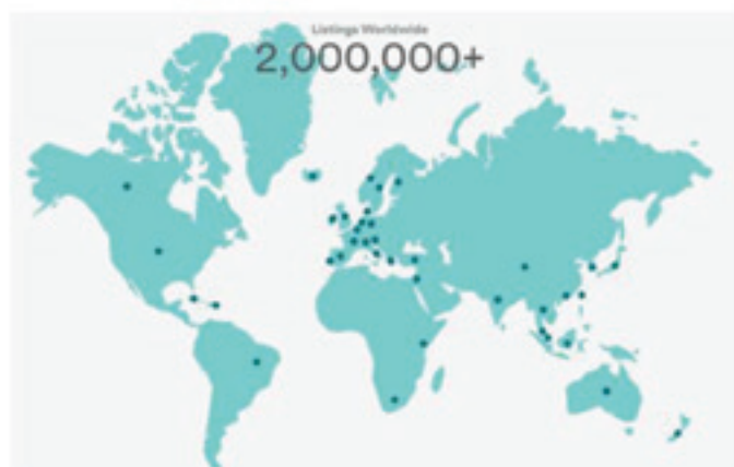
Figure 21: Airbnb – a global phenomenon